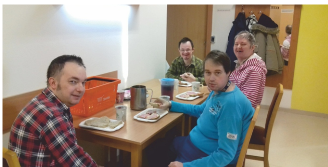
Personál tréninkového bytu

Protože všechny začátky jsou těžké, přejeme jim hodně sil a výdrže na dlouhé cestě za životem v běžné společnosti.