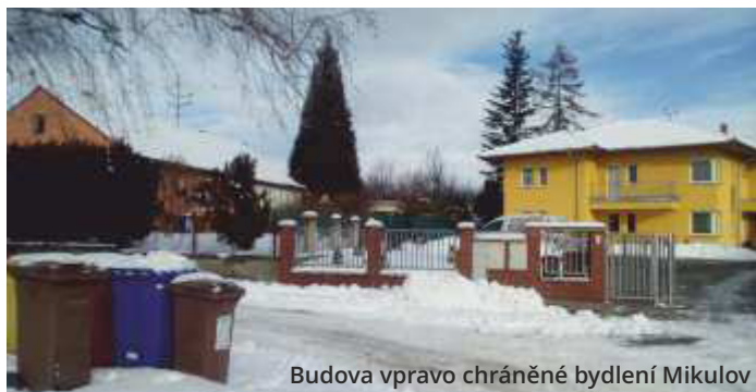
Budova vpravo chráněné bydlení Mikulov

12 uživatelů DOZP v Klentnici, se na život v chráněném bydlení připravovalo v patřičně dlouhé době před