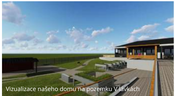
Vizualizace našeho domu na pozemku V lávkách

Stavební práce by mohly začít během 2024 a předpokládané zahájení poskytování sociální služby je nejdříve 2. polovina roku 2025. Tento časový plán je předběžný, protože během realizace může dojít ke spoustě nečekaných změn, které mohou zpomalit.