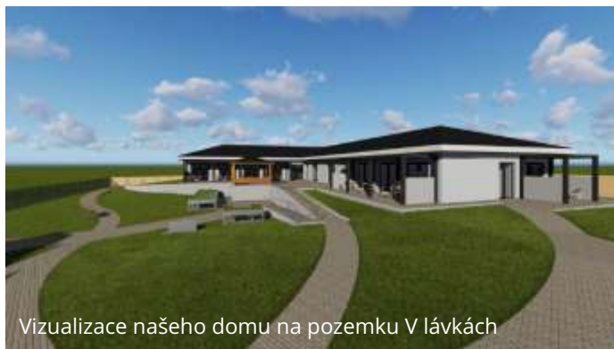
Vizualizace našeho domu na pozemku V Lávkách

Vážení čtenáři, doufáme, že toto číslo časopisu Vám přinese aktuální informaci a odpovědi na Vaše dotazy vztahující se k danému tématu. Vážíme si Vaší podpory a jsme připraveni informace doplnit, dle Vašich dalších otázek.