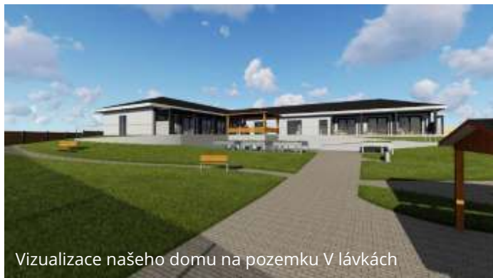
Vizualizace našeho domu na pozemku V lávkách

Ve velkém zařízení, žije společně na bytě, nebo domácnosti 10 a více lidí pohromadě, už to samo o sobě vylučuje trvalou shodu, hned na vedlejší domácnosti je jich dalších 10 a v celém domě je jich např. 80. Co bude k obědu určuje jídelníček z jídelny, kdy se bude na pokoji klienta uklízet určuje pracovní doba uklízeček, kdy se bude prát určuje velikost a kapacita prádelny. Na každém oblečení musí mít klient vlastní značku. Pokud nemá klient vlastní televizi, tak se musí shodnout na programu s dalšími 10 lidmi, jednolůžkových pokojů je minimum.... Z legislativního hlediska se jedná o totožné služby, ale kvalita života je v nich diametrálně rozdílná.